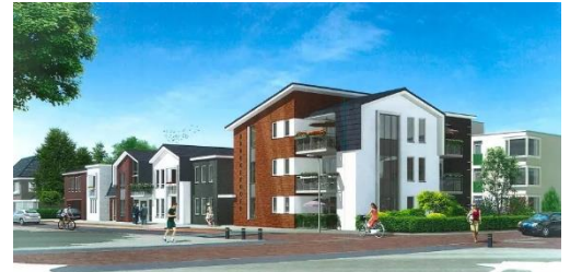
Appartementen gebouw Bruggehoofd